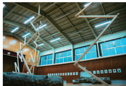
植松奎二／みえないエネルギー 天と地と海との間に