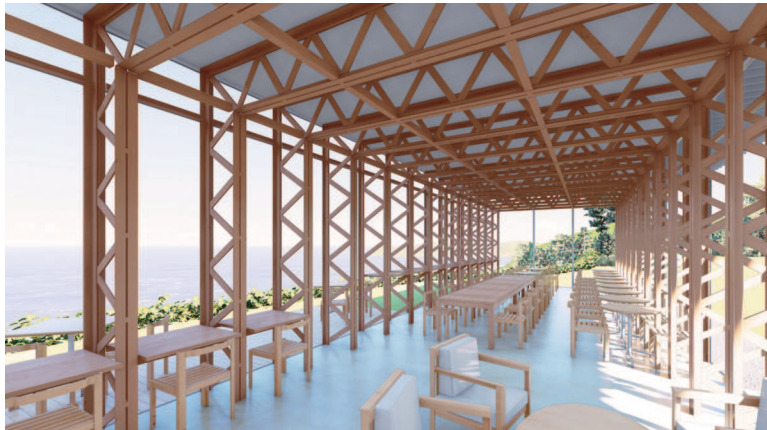
レストラン館内 ※イメージ